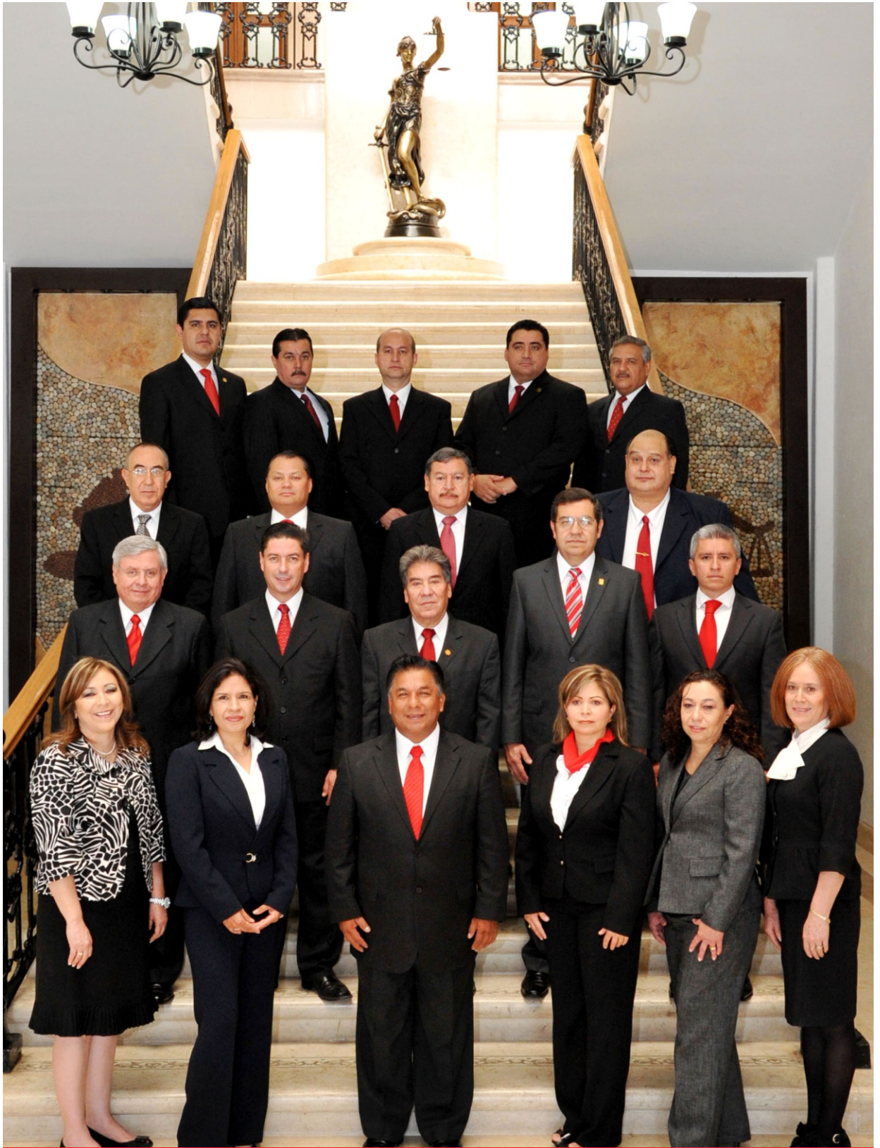
MAGISTRADOS DEL HONORABLE TRIBUNAL SUPERIOR DE JUSTICIA